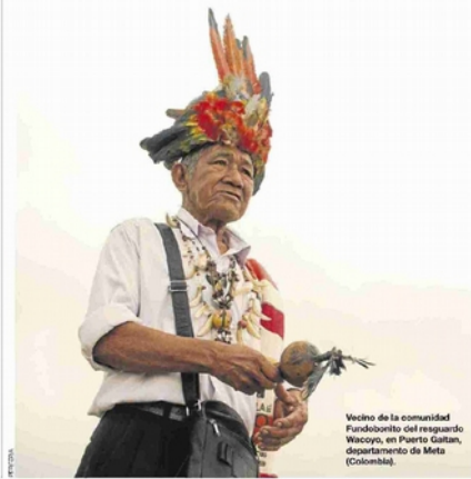
Vecino de la comunidad Fundobonito del resguardo Wacayo, en Puerto Gallán, departamento de Meta (Colombia).

500 LÍDERES ASESINADOS DESDE QUE EL GOBIERNO DE COLOMBIA FIRMÓ LOS ACUERDOS CON LAS FARC